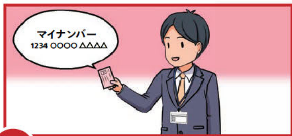
A 個人番号(マイナンバー)