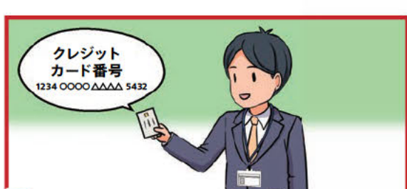
C クレジットカード番号