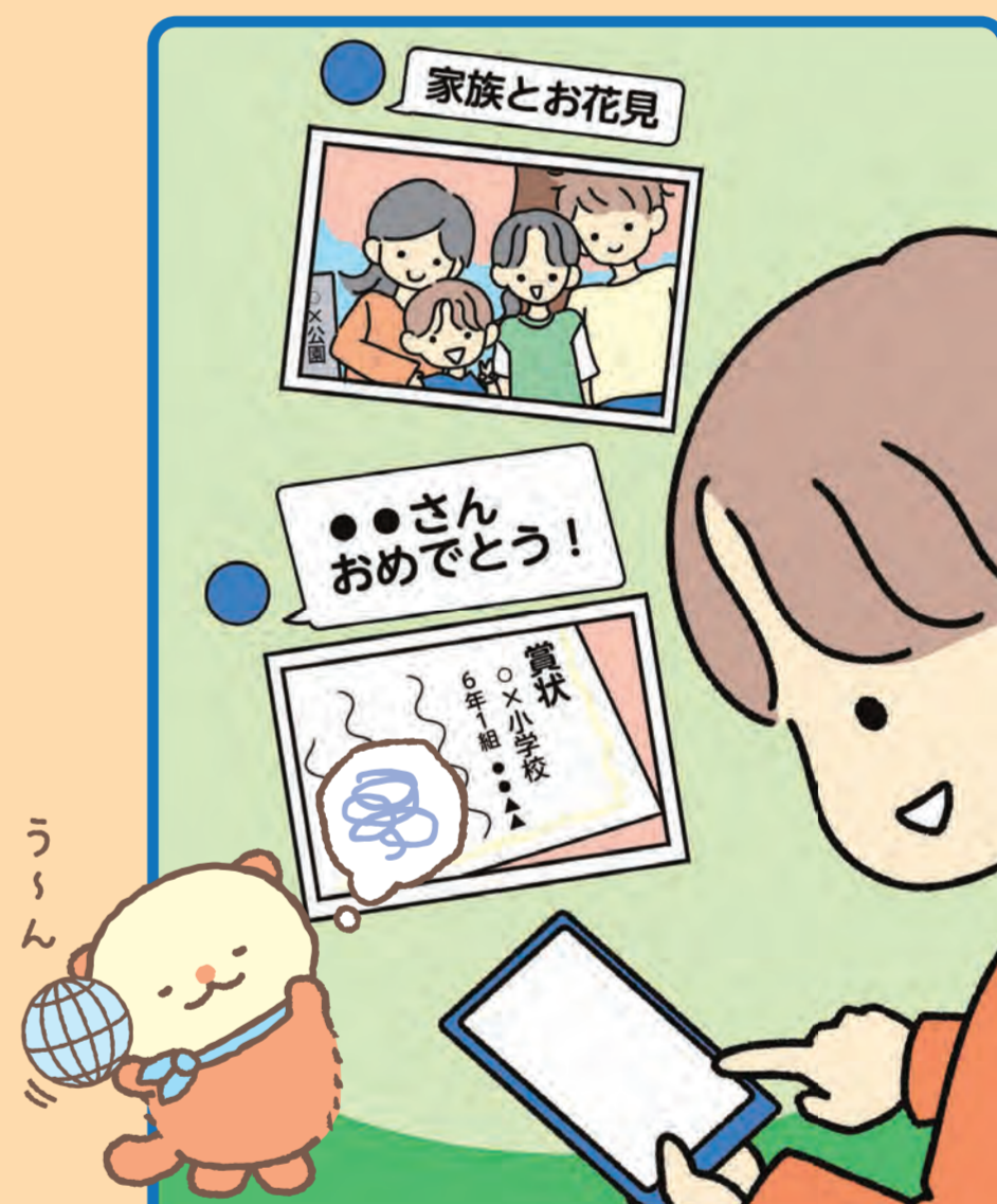
家族や友達の個人情報を扱うとき