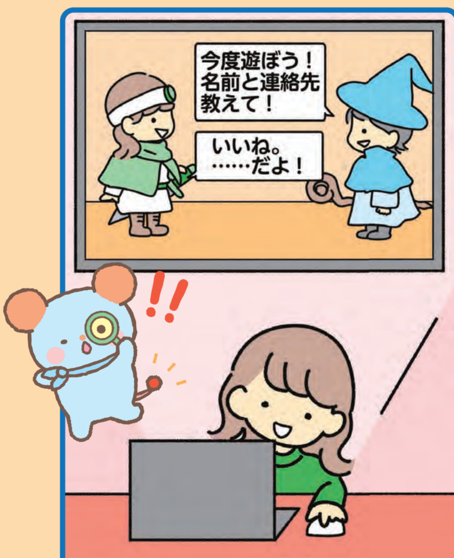
オンラインゲームで遊ぶとき