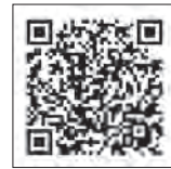
パンフレット 掲載ページ

本採用パンフレット及び業務案内のパンフレットを ( https://www.ppc.go.jp/news/recruit/general/ ) に掲載しております。当委員会の業務内容についてより詳しく知りたい方は、業務案内のパンフレットをご覧ください。